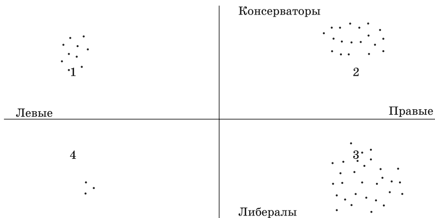
Идеологическая поляризация аналитических центров России

носятся они к праволиберальным. Самые авторитетные из них: Институт современного развития (ИНСОР), Московский центр Карнеги, фонд «ИНДЕМ», Информационно-аналитический центр «Сова», Центр «ЕС-Россия», Экспертный институт Российского союза промышленников и предпринимателей и многие другие. Анализ историй становления подавляющего большинства праволиберальных экспертных структур показывает, что они созданы при поддержке зарубежных, преимущественно из США, неправительственных организаций и функционируют за счет грантов и пожертвований этих институтов [1, с. 24]. Эти аналитические центры вынуждены «выживать» на иностранные средства, поскольку изначально находятся в оппозиции к действующей власти и ввиду крайне небольшого и нестабильного спроса на их аналитическую продукцию в России.