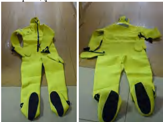
Рис.1. Изображение внешнего вида объекта исследования – образца № 1 (изделие артикула «(91)PS20140254020-SIZE: UNIVERSAL 140-200 см, 50-100 KG»)