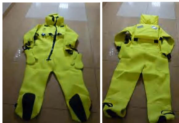
Рис.2. Изображение внешнего вида объекта исследования – образца № 1 (изделие артикула «(91)PS20070258000-SIZE: 58 170-210 см, 80-160 KG»)

Поставляется упакованным в индивидуальные сумки.