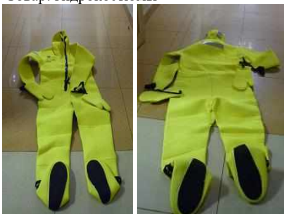
Рис.1. Изображение внешнего вида объекта исследования – образца № 1 (изделие артикула «(91)PS20140254020-SIZE: UNIVERSAL 140-200 см, 50-100 KG»)