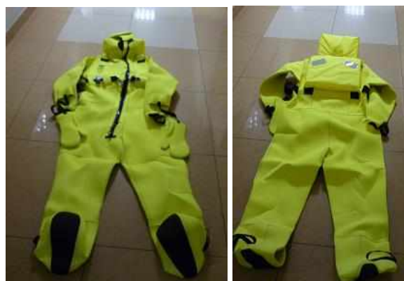
Рис.2. Изображение внешнего вида объекта исследования – образца № 1 (изделие артикула «(91)PS20070258000-SIZE: 58 170-210 см, 80-160 KG»)

Поставляется упакованным в индивидуальные сумки.