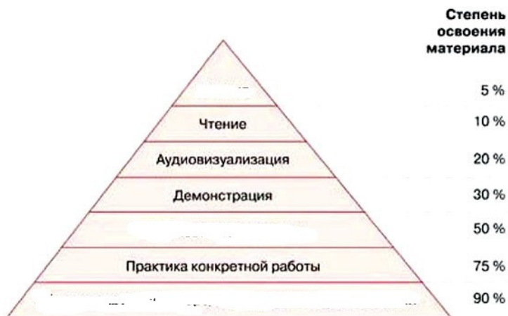
Конус опыта Э. Дейла